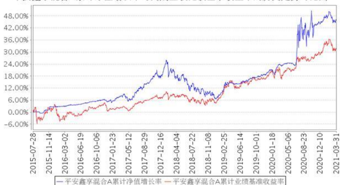
平安鑫享混合A累计净值增长率与同期业绩比较基准收益率的历史走势对比图