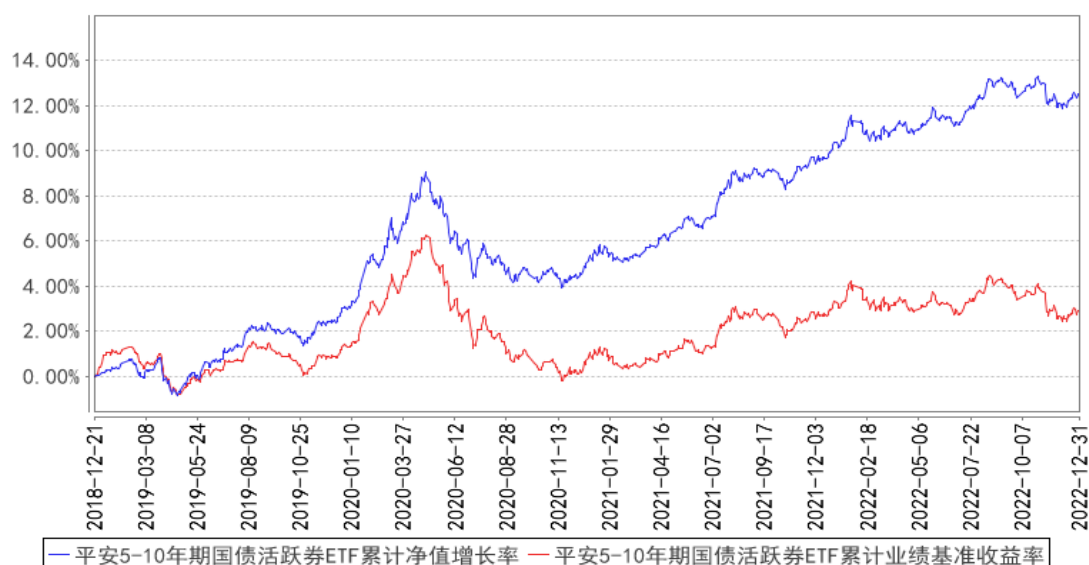
平安5-10年期国债活跃券ETF累计净值增长率与同期业绩比较基准收益率的历史走势对比图