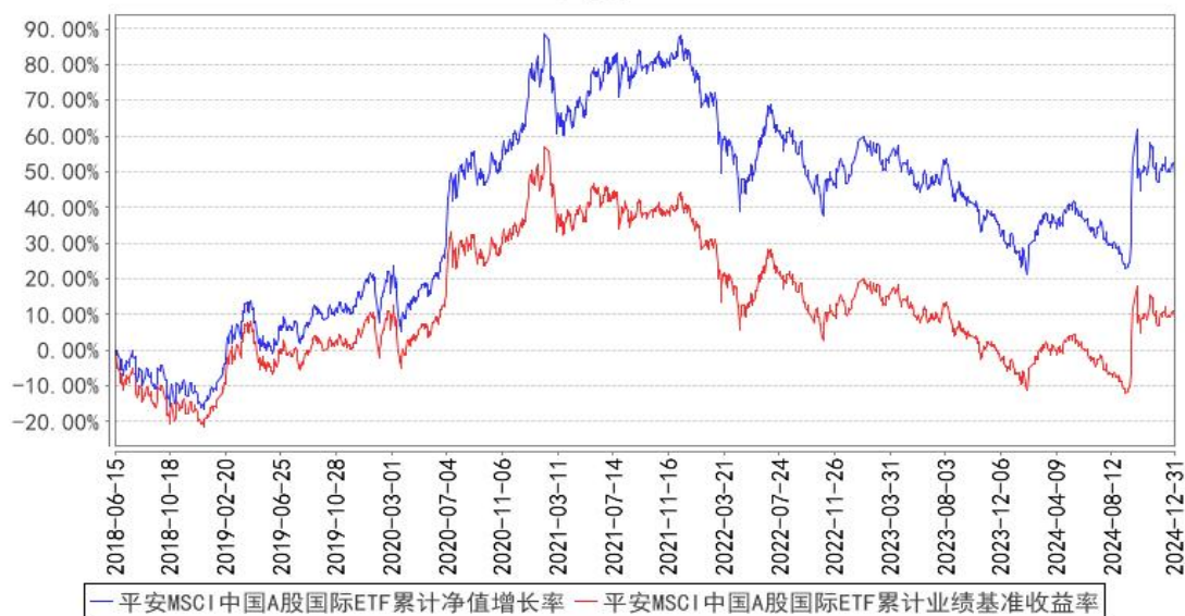
平安MSCI中国A股国际ETF累计净值增长率与同期业绩比较基准收益率的历史走势对比图